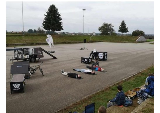
Nikol Šestáková, 9. B