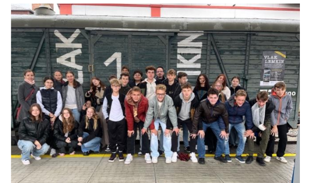
Žáci 9. B

Exkurzi bychom doporučili všem, co se zajímají buď o toto téma, nebo o historii všeobecně. Měli bychom jen jednu jedinou námitku: slíbili nám kebab a nebyl na něj nakonec čas.