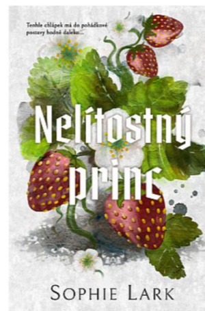
Pavla Ondryšková 9.A

Od autorky bych si ráda ještě něco přečetla, ale bohužel jsou zatím všechny její knížky jen v angličtině, tak musím čekat na překlad.